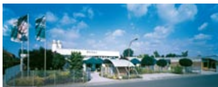
Silikal, Produktion und Verwaltung in Mainhausen, Frankfurt am Main