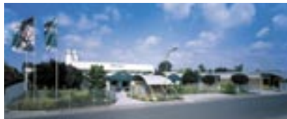
Silikal, planta de producción y administración en Mainhausen (Alemania)