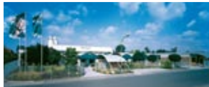
Silikal, planta de producción y administración en Mainhausen (Alemania)